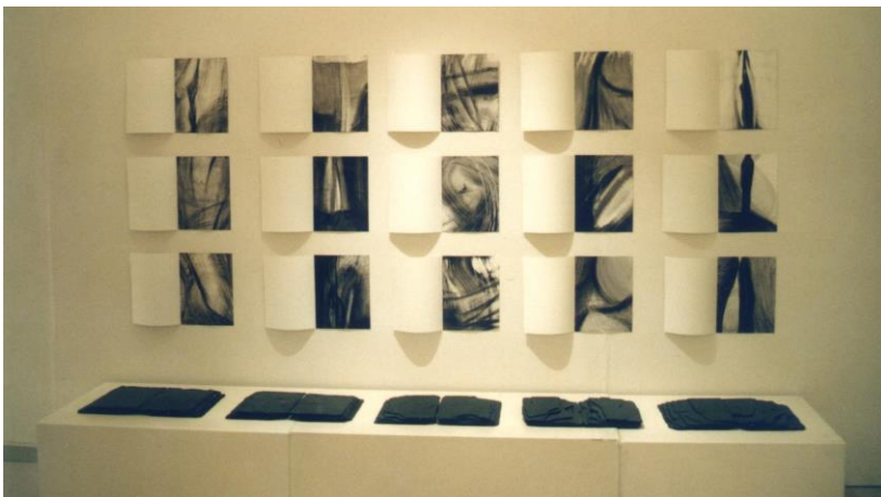
Livres en ardoise et dessins à l'encre de Chine.

* 5 livres-ardoise et 15 encres de chine.